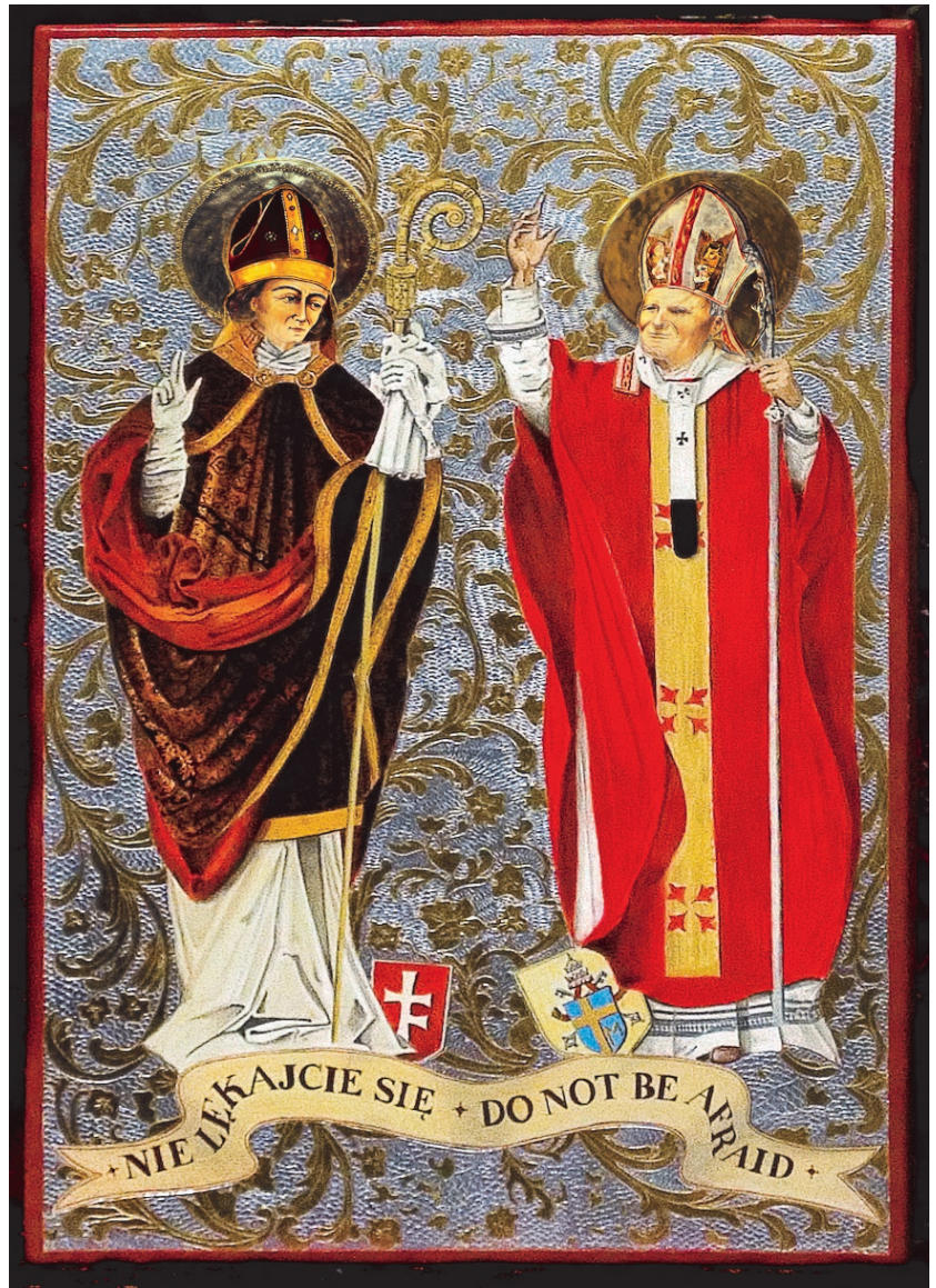
Icon of Saint Stanislaus and Blessed John Paul II