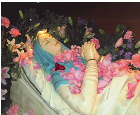
The image of Mary in dormition, covered in rose petals..... at last week's vigil.