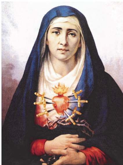
Matka Bolesna—Sorrowful Mother