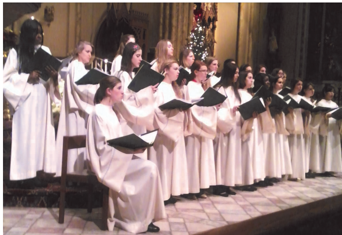
Last Friday's Notre Dame Choir Concert! Very Uplifting!

Church practice asks that in no way to we think of this practice as “buying a Mass,” or thinking of a given Mass as “my Mass.” Every Mass is a celebration of the entire community, and the intention is the special focus for the prayer of the priest celebrating it.