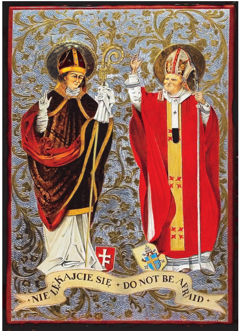
Icon of Saint Stanislaus and Blessed John Paul II