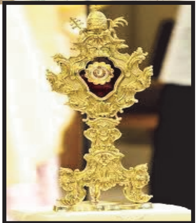
THE REIQUARY HOLDING THE RELIC OF ST. JOHN PAUL II